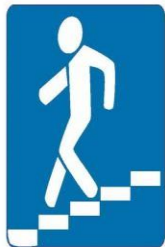
Знак 6.6. Подземный пешеходный переход

Самые безопасные переходы — подземный и надземный. Они обозначаются вот такими знаками.