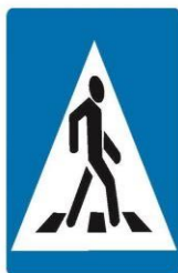
Знаки 5.19.1 и 5.19.2 Пешеходный переход