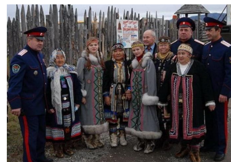
Русскоустыинцы - исчезающая народность Севера

Национальная одежда – платья, накидки из оленьих шкур, хорошо утепленные мехом, вместо ниток использовались олени сухожилия. Мужчины носили шаровары из оленьих лап, дундуки (рубашки из оленьих шкур), меховые ботинки. Женщины покрывали голову, платок или шаль завязывали по русскому обычаю.