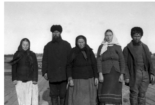
Русскоустыинцы - потомки новгородцев.

Русские переселенцы перенимали у жителей Севера знания об обустройстве быта в тяжелых климатических условиях. Среднегодовая температура в этих местах не поднимается выше 15 градусов. Основной местный промысел – рыбная ловля и охота. Чтобы было удобнее добывать пропитание, русскоустыинцы строили два дома: один возле реки, где в теплое время года можно ловить рыбу, а второй – на противоположном (высоком) берегу, поближе к охотничьим угодьям.