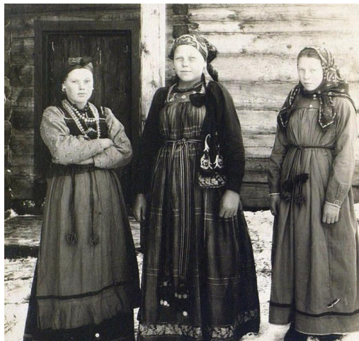
Женщины из Русского Устья.

Русскоустыинцы – одна из исчезающих народностей Сибири. Это потомки новгородских мореплавателей, которые в конце XVI века отправились искать счастья в далекий и неизведанный край. Культура русскоустыинцев уникальна: здесь сохранились архаичные формы русского языка, а привычные нам традиции и обряды пережили серьезные трансформации. Например, во время свадьбы здесь ломают не каравай, а крыло лебедя, а в качестве деликатеса гостям подают костный жир из берцовой кости оленя.