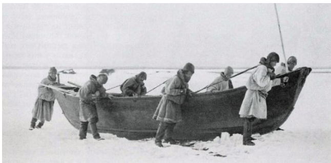
Русскоустыинцы - охотники и рыболовы.

Второе название русскоустыинцев – индигирщики. Произошло оно от названия реки Индигирка, в устье которой и обосновались первые поселенцы. Новгородцы бежали от преследований Ивана Грозного, они были умелыми мореплавателями и смогли добраться в этот отдаленный регион. Помимо мореходов, была еще одна группа, которая добиралась в Сибирь по земле. Часть современных жителей Русского Устья – потомки тобольских казаков.