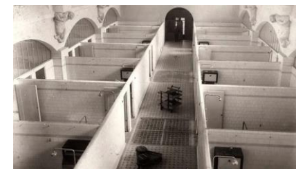
Клиника бальнеологии, Минеральные Воды.