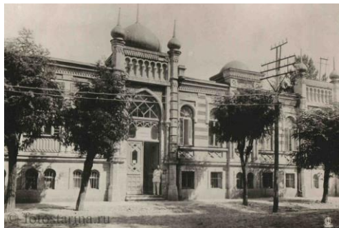
Клиника бальнеологического института. Пятигорск.

Бальнеотерапия — лечение минерализованными природными водами и грязями — очень древняя медицинская практика. Но наука о таком лечении — бальнеология — в современном ее виде сформировалась и стала одним из главных разделов клинической физиотерапии только во второй половине XIX века